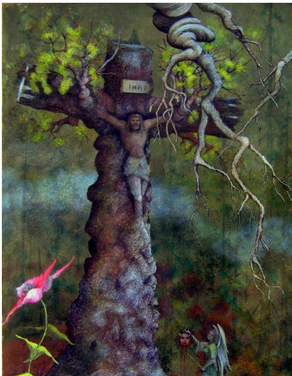
Cristo, olio di Alberto Thirion: https://thirion.medium.com/e1-camino-de-la-vida-por-alberto-thirion-d8e4debed2b

la creazione geme e soffre le doglie del parto fino ad oggi” (Rom 8,20-22). E soprattutto il Testamento cristiano non manca di evidenziare l'effetto cosmico della redenzione, che inaugura “cieli nuovi” e “nuova terra”: “E vidi un cielo nuovo e una nuova terra: il cielo e la terra di prima infatti erano scomparsi e il mare non c'era più” (Ap 21,1). E ancora: “Noi infatti, secondo la sua promessa, aspettiamo nuovi cieli e una terra nuova , nei quali abita la giustizia” (2 Pt 3,12). Anche la creazione dunque partecipa del riscatto dell'uomo in ragione della venuta del Regno “già” presente e proiettato nel “non ancora” del futuro escatologico. 3 Il carattere di tessuto relazionale che qualifica